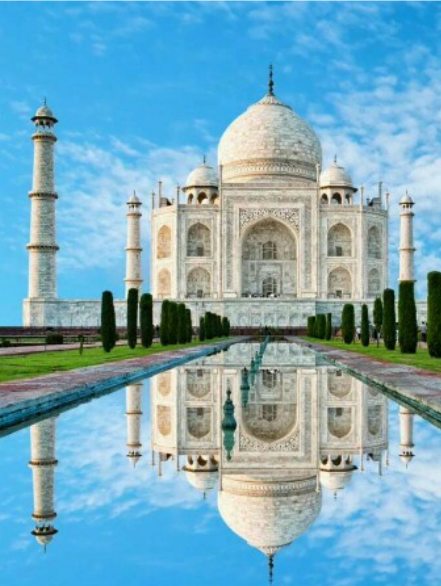
তাজমহলৰ পূৰ্বৰ দৃশ্য(A)